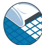
ブラッシング機能