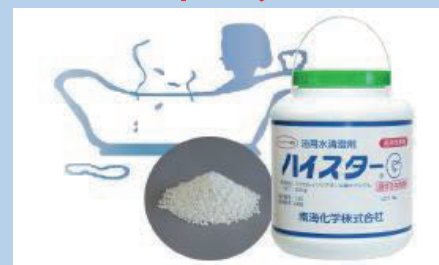
有効成分：ジクロロイソシアヌール酸ナトリウム顆粒 包装仕様：10kg段ボール箱入(2.5kgポリ容器×4缶)