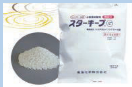
有効成分：トリクロロイソシアヌール酸顆粒 包装仕様：10kg段ボール箱入(1kg×10袋)