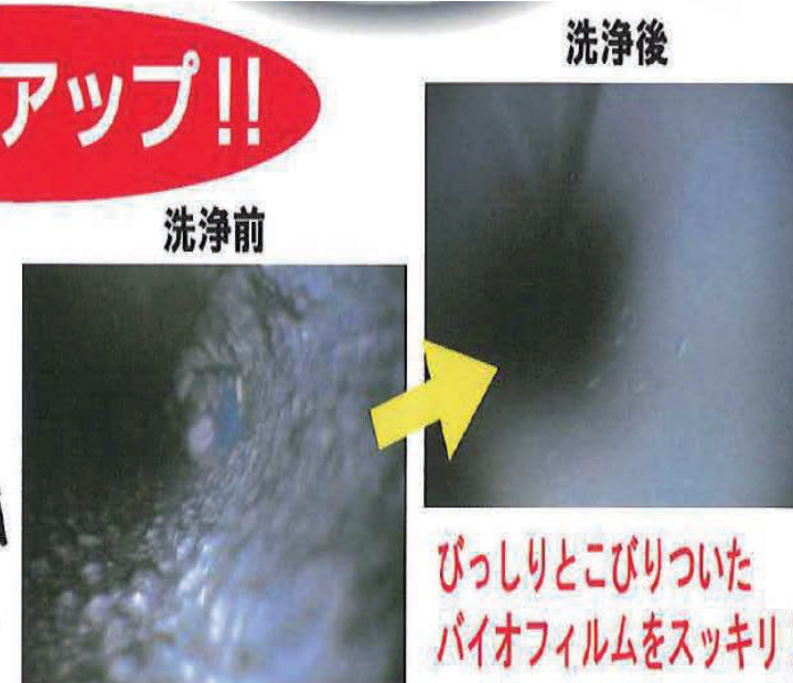
びっしりとこびりついた バイオフィルムをスッキリ!

配管内の 洗浄力アップ!! バイオフィルムを 強力洗浄!! レジオネラ属菌 対策に!!